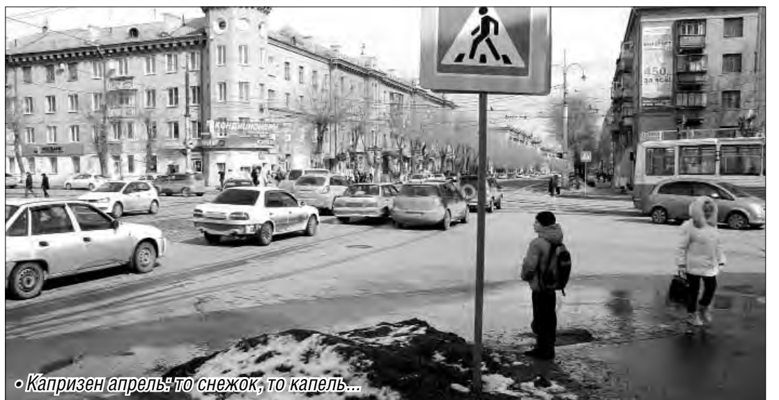
«Капризен апрель: то снежок, то капель...»

В общем же специалисты Гидрометцентра России делают вывод, что в апреле в Челябинской области ожидается температурный режим, близкий к средним многолетним значениям, – это четыре градуса тепла, месячное количество осадков на этот период составляет 24 миллиметра. В течение наступающей недели мы будем наблюдать незначительное снижение температур. Ночью от минус трех градусов (в начале недели) до минус семи (в пятницу), днем – от трех градусов до нуля. В четверг ожидается облачная погода, дождь со снегом, в пятницу – переменная облачность, без осадков. Неустойчивая погода прогнозируется и в середине месяца. С 14 по 20 апреля в карте синоп-