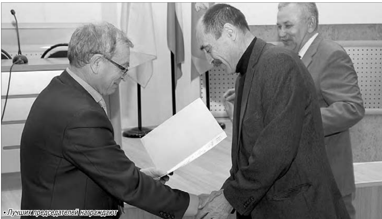
• Лучших председателей награждают

Ассоциации садоводов Магнитогорска исполнилось десять лет