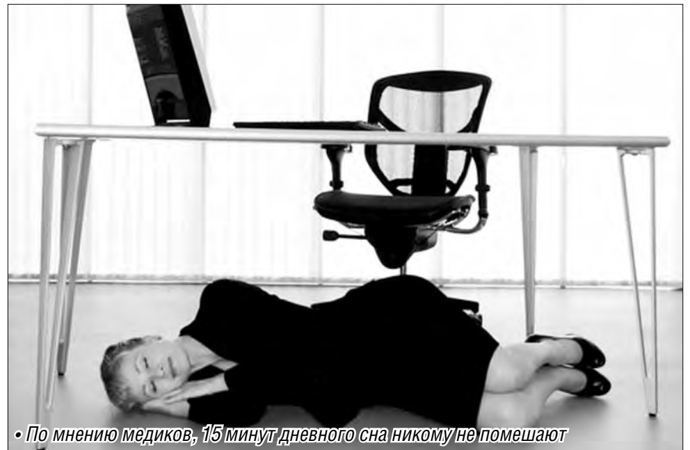
• По мнению медиков, 15 минут дневного сна никому не помешают

Большинство кадровиков назвало предложение абсурдным хотя бы потому, что во многих компаниях даже день отпуска за свой счет для похода к врачу надо выбивать с боем, а сверхурочная работа считается нормой. Подобная сиеста удлинит рабочий день, и людям придется добираться домой ночью.