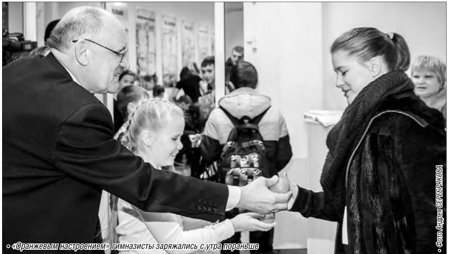
«Оранжевым настроением» гимназисты заряжались с утра пораньше

Вчера в гимназии №53 отмечали Всемирный день здоровья