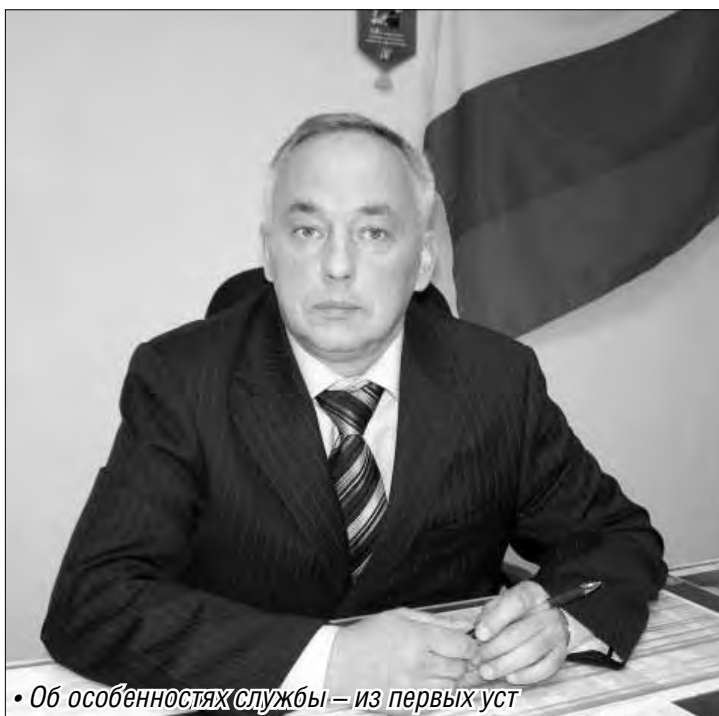
• Об особенностях службы – из первых уст

нет централизованное обеспечение военнослужащих средствами личной гигиены. Каждому бесплатно будут выданы шампунь, гель для душа, зубная паста, зубная щетка, гель для бритья, дезодорант, крем для рук, бритвенный станок и полотенце. Комплект позволит новобранцу чувствовать себя комфортно в не привычных для него армейских условиях.